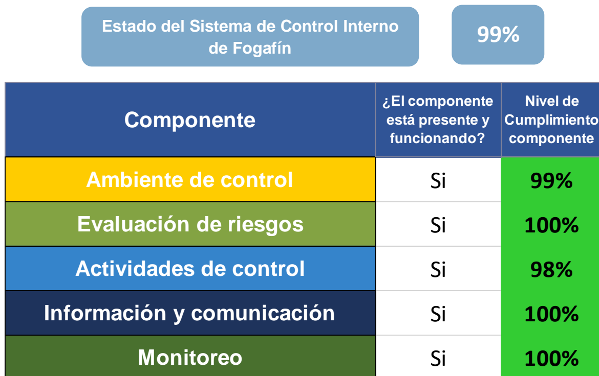
Gráfico 2. Resultados Evaluación Independiente del Estado del Sistema del Control Interno – Julio a Diciembre de 2020

Se verificaron y analizaron cada uno de los aspectos y se determinó su clasificación, descripción y observaciones del control. De acuerdo con los resultados obtenidos en la evaluación, el Sistema de Control Interno presentó una Calificación del 99% equivalente a “Mantenimiento de Control” , el cual conforme a la metodología se interpreta: “Cuando en el análisis de los requerimientos en los diferentes componentes del MECI se cuenta con aspectos evaluados en nivel 3, el cual se establece como: “Presente y Funcionando” y, se asocia como observaciones de control referentes a: “Se encuentra presente y funciona correctamente, por lo tanto se requiere acciones o actividades dirigidas a su mantenimiento dentro del marco de las líneas de defensa”. (Ver Gráfico 2)